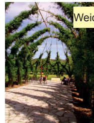
Weidenkirche in Pappenheim

Der ökumenische Pilgerweg soll, so wünschen es sich die Initiatoren, einem lebendigen Austausch zwischen katholischen und evangelischen Christen dienen und auf diese Weise vom „ Getrenntsein “ zu einem „ Miteinandergehen “ führen.