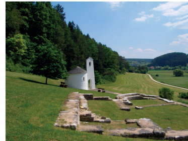
Ökumenische St. Gunthildiskapelle