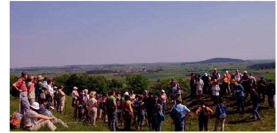
Probepilgern am Fest der Ökumene (22. Mai 2011)

Auf den Spuren... der christlichen Glaubensboten Willibald, Wunibald, Walburga und Sola