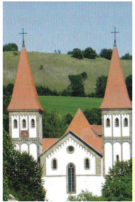
Klosterkirche mit Wunibaldgrab