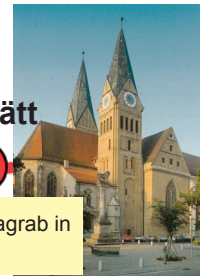
Mariendom mit Willibaldgrab, Walburgagrab in der Wallfahrtskirche St. Walburg